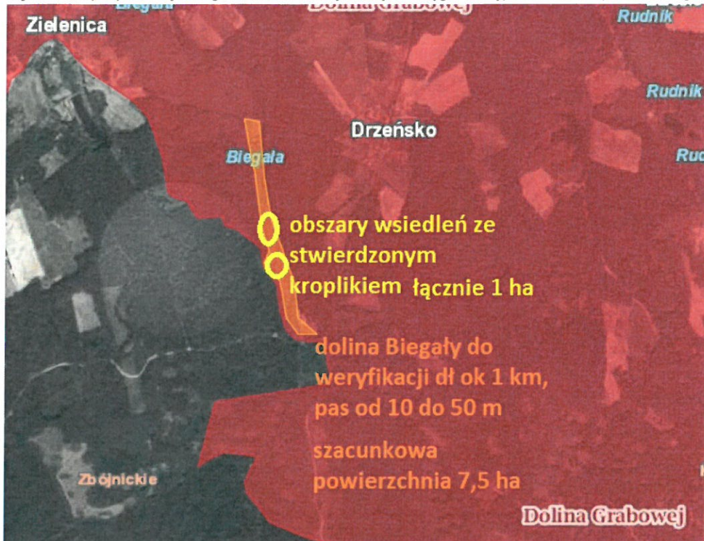
Rys. 2 Poglądowa mapa szczegółowa obszaru działania - część płn.