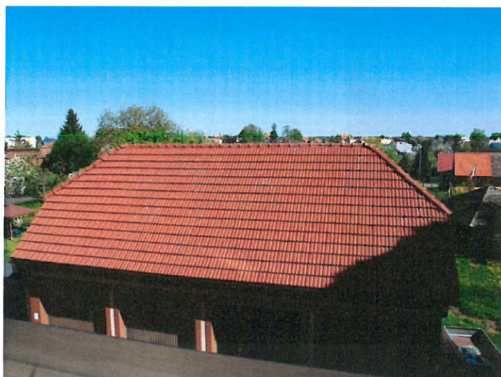
3. Budynek Muzealno – Dydaktyczny na „Świdwiu”