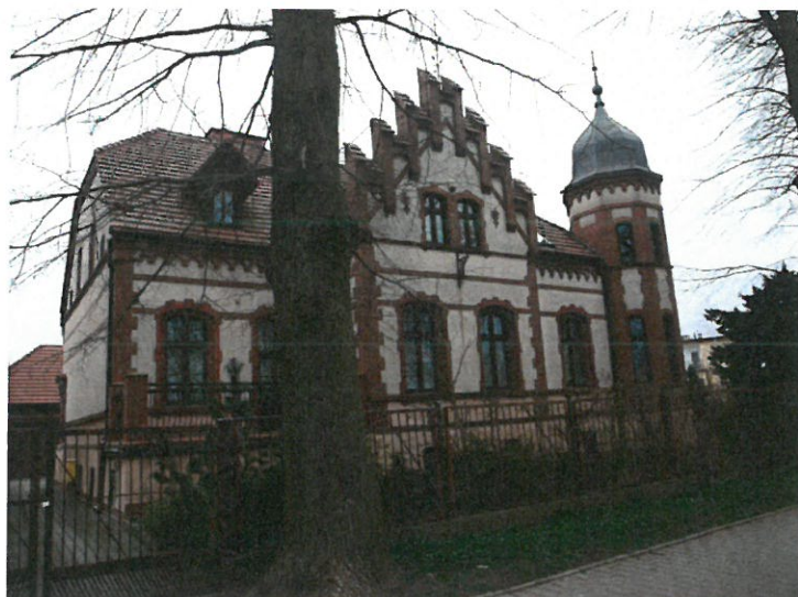
2. Budynek garażowy Wydziału Spraw Terenowych w Złocięcu