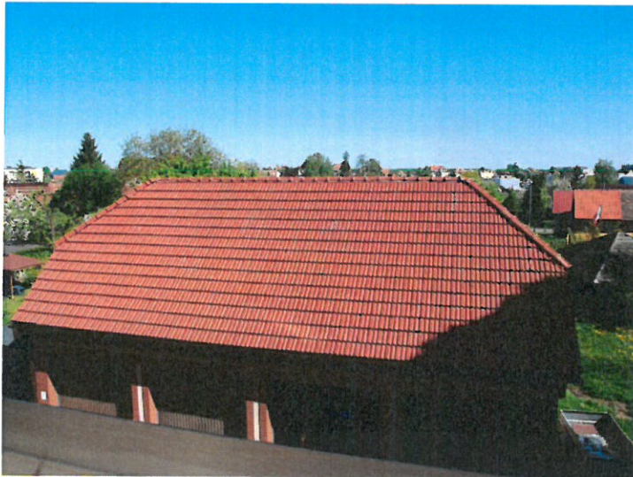
3. Budynek Muzealno – Dydaktyczny na „Świdwiu”