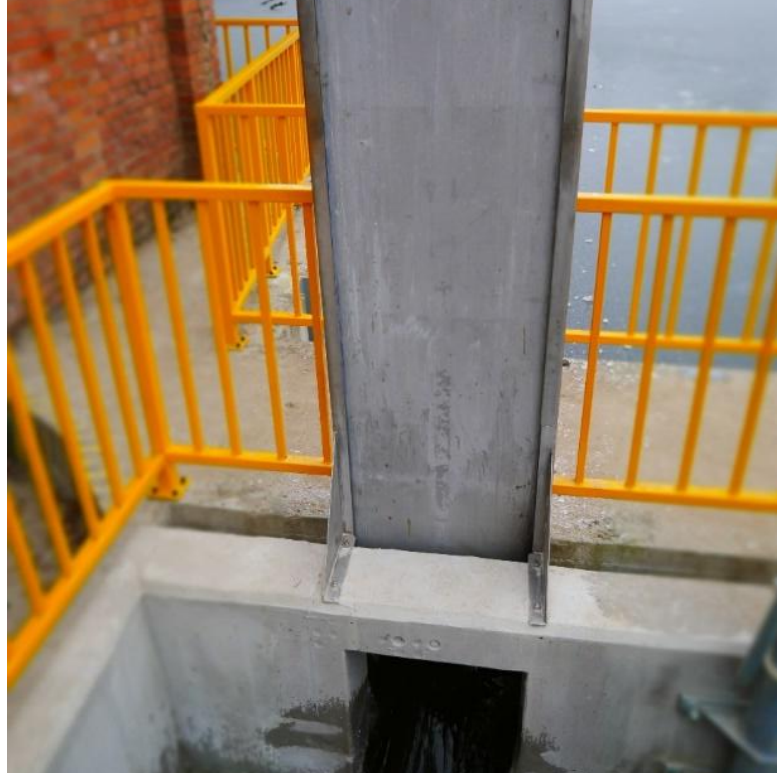
W załączeniu do SIWZ rys. 13A. Wlot i wylot. Rzuty i przekroje