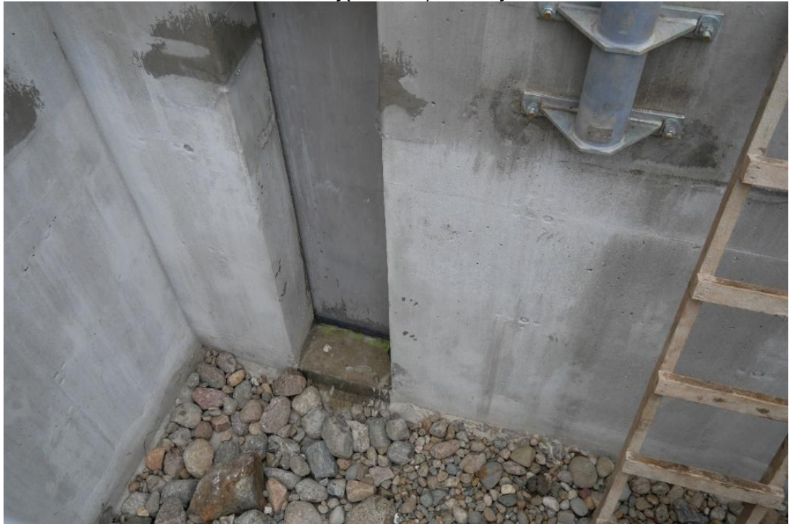
Fot. Zdjęcia komory wlotowej